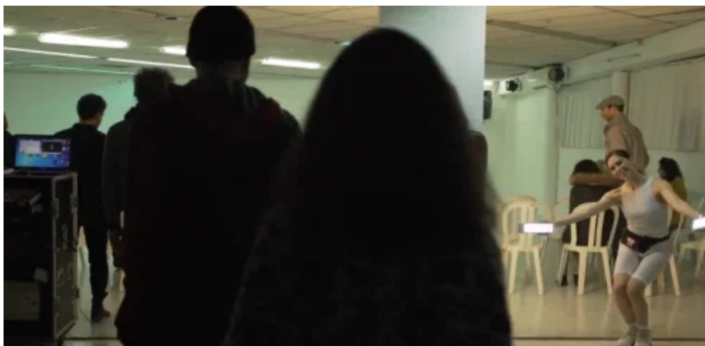
פתיחת it itches מאת עדו פדר.

הסדרניות אוהזות בפנסים לבנים בוהקים כמו הגזמה של הכפפות הלבנות של שוטרי תנועה. הפנסים המלבניים שכמו מחליפים את כפות ידיהן, הופכים אותן לדמויות סייבורג בערך (סייבורג – ישות שמורכבת מחלקים ביולוגיים ומלאכותיים); בערך, לא במובן שיפוטי אלא תיאורי, החיבור שטחי וארעי.