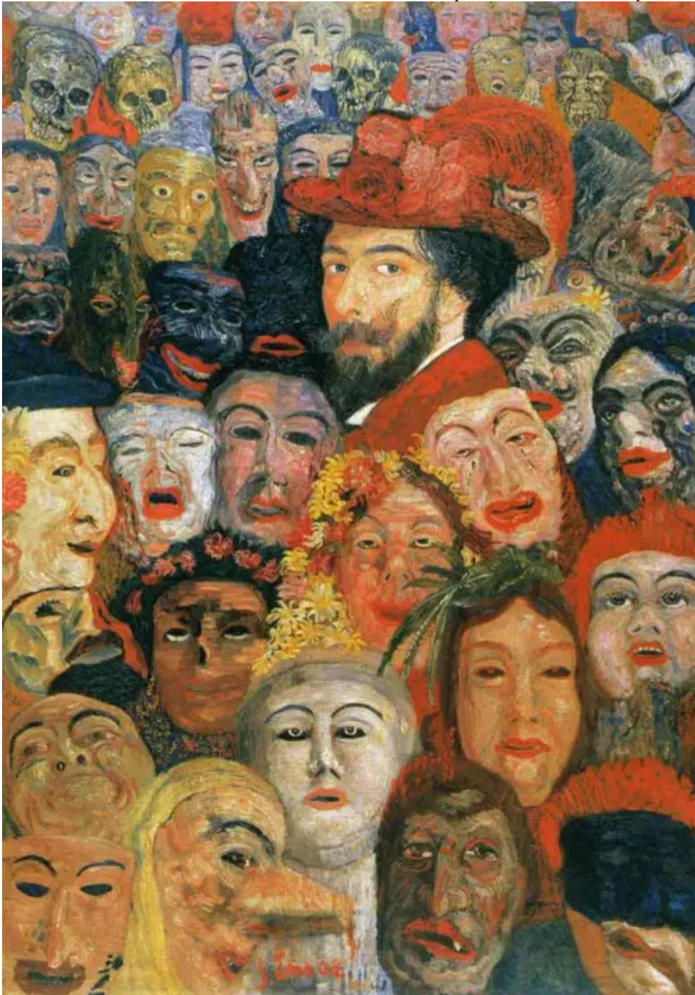
גיימס אנסור, דיוקן עצמי עם מסכות, 1899

בשנות החמישים של המאה הקודמת כתב רולאן בארת על תרבות הפרסומת: "האמירה ש[אבקת הכביסה] אומו מנקה לעומק ... מניחה שלכבסים יש עומק, מה שאיש מעולם לא העלה על דעתו, " (הציטוט המלא כאן https://maritbenisrael.wordpress.com/2011/05/26/%d7%90%d7%a0%d7%a0%d7%99-%d7%9c%d7%99%d7%91%d7%95%d7%91%d7%99-%d7%a5-%d7%95%d7%95%d7%a4%d7%99-%d7%92%d7%95%d7%9c%d7%93%d7%91%d7%92 ) לוקחת את העומק שהוא של הכביסה ומחילה אותו בחזרה על בני אדם.