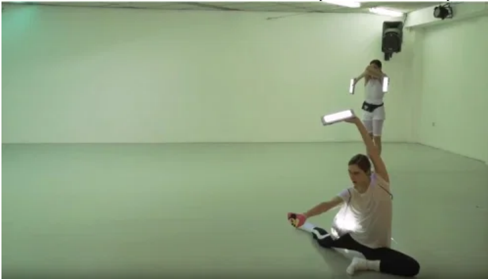
מתוך it itches מאת עדו פדר

למטה, סרטון בעקבות העלאה מחדש של "איינשטיין על החוף". בדקה 1:10 אפשר לראות שיחזור של ריקוד הפנסים.